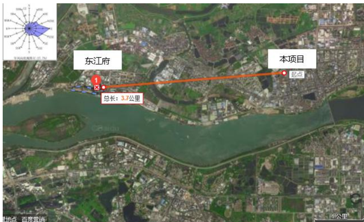
图 3-2 环境空气质量监测点位图

为进一步了解项目所在地的大气环境，本次评价引用惠州市精奢创展科技有限公司委托深圳立讯检测股份有限公司于2020年10月29日~2020年10月31日检测的数据，引用的监测点位为G1东江府，监测编号LCS201022002AH。距本项目西面3.7km。由于本项目距离所引用大气监测数据的监测点约为3.7km<5km，且引用大气监测数据时效性为3年内，因此，引用该监测数据是可行的。